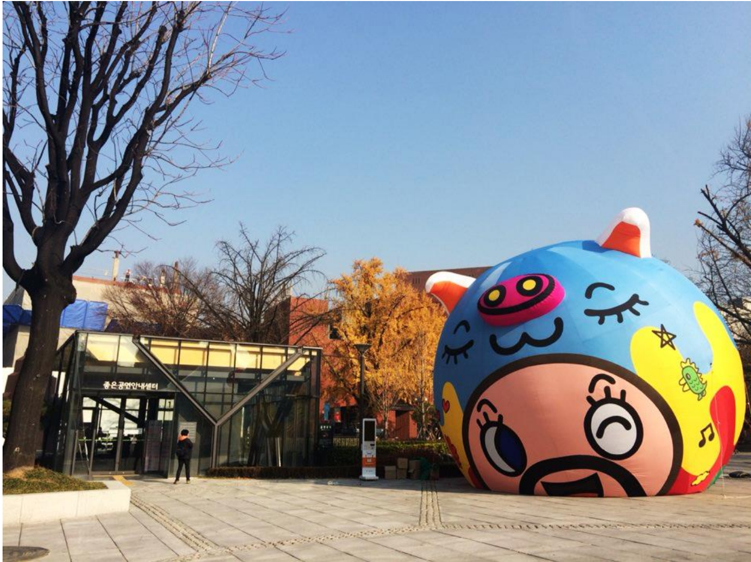
〈마로니에공원, 미스터기부로 작품 옆 비치〉