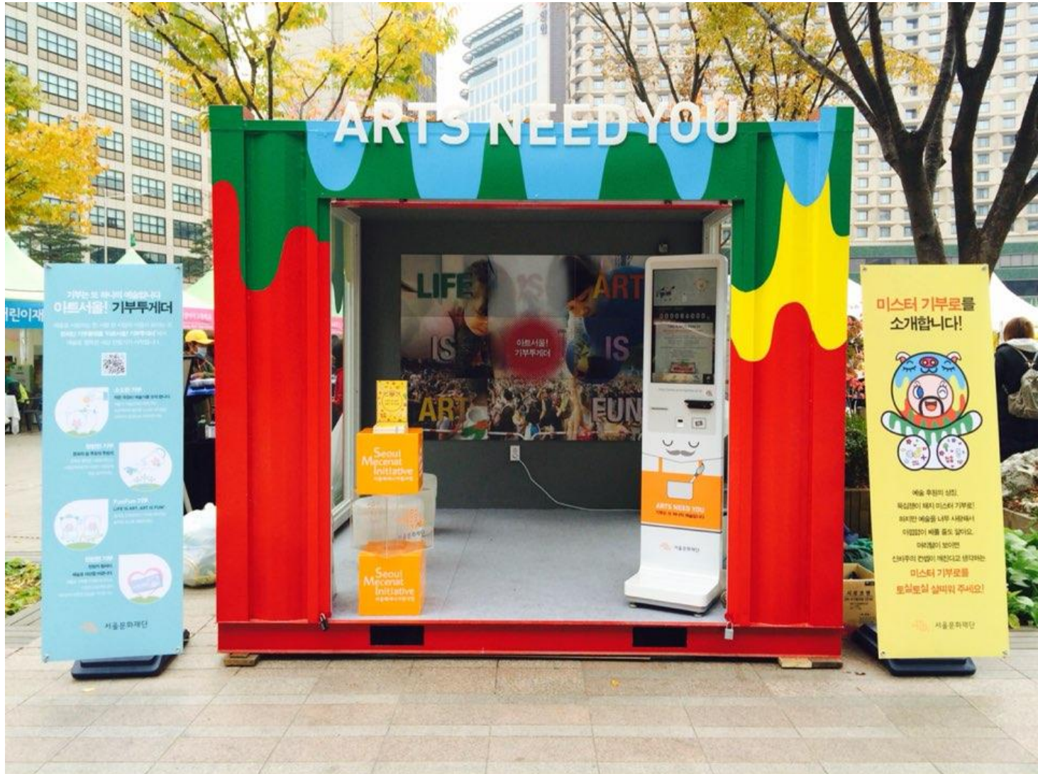
〈서울광장, 컨테이너갤러리 내 비치〉